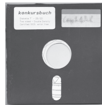
Geplantes Cover konkursbuch Nr. 22, Computer (in den Achtzigern). Die Herausgeber fürchteten, dass die bereits geschickten Beiträge bei Erscheinen schon nicht mehr aktuell gewesen wären, und zogen das Buch zurück.

konnten wir damals nicht, denn es gab noch keine PCs – es war also nur Zufall, dass es bei uns der Computer wurde, dass wir mit dem stabileren Gerät anfangen. Auf dem 8-Zeilen-Bildschirm ließ sich also eine Kundennummer eingeben, und wenn sie stimmte, erschien die Bestelladresse, dann mussten noch Bestellzeichen eingegeben werden, und dann wurden die Titel eingetiggert.